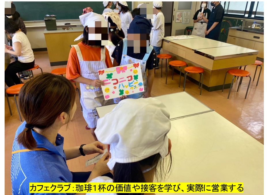
カフェクラブ: 珈琲1杯の価値や接客を学び、実際に営業する