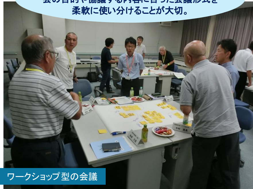
ワークショップ型の会議

どちらの会議形式も良し悪しあり、 会の目的や協議する内容に合った会議形式を 柔軟に使い分けることが大切。