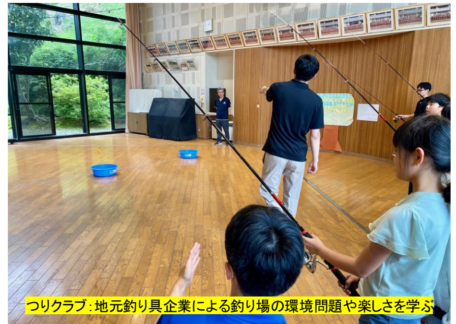
釣りクラブ: 地元釣り具企業による釣り場の環境問題や楽しさを学ぶ